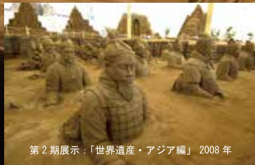
第2期展示：「世界遺産・アジア編」2008年