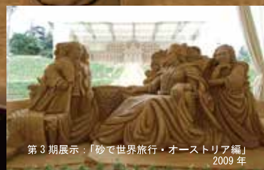
第3期展示：「砂で世界旅行・オーストリア編」2009年