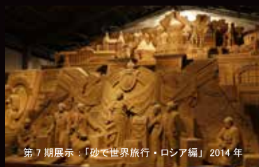
第7期展示：「砂で世界旅行・ロシア編」2014年