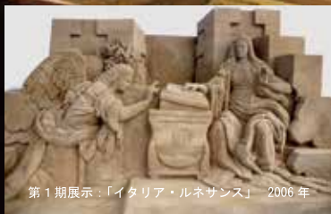
第1期展示：「イタリア・ルネサンス」2006年