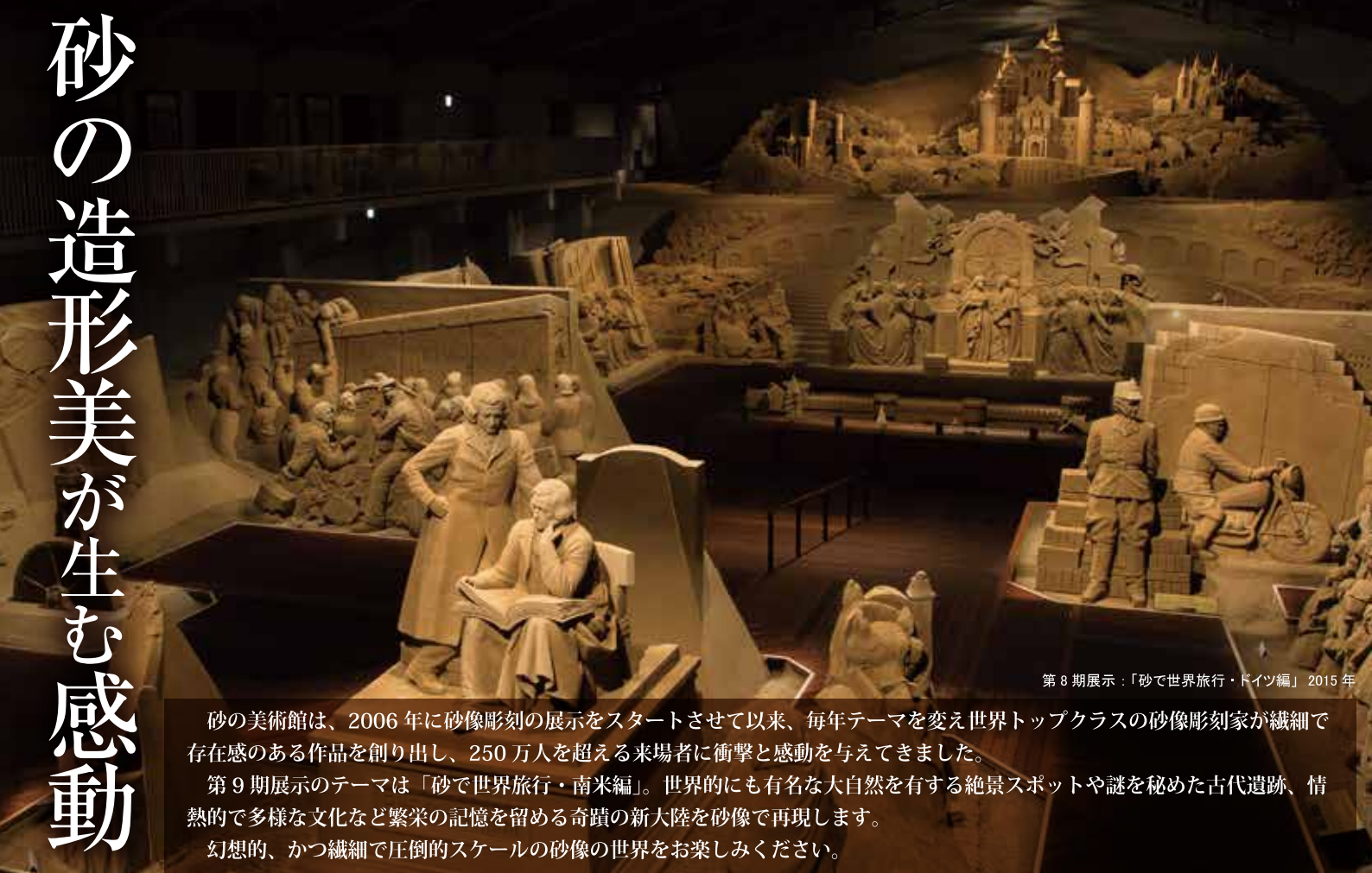
第8期展示：「砂で世界旅行・ドイツ編」2015年

砂の美術館は、2006年に砂像彫刻の展示をスタートさせて以来、毎年テーマを変え世界トップクラスの砂像彫刻家が繊細で存在感のある作品を創り出し、250万人を超える来場者に衝撃と感動を与えてきました。