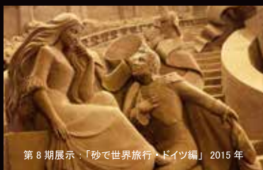
第8期展示：「砂で世界旅行・ドイツ編」2015年