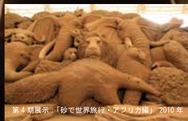
第4期展示：「砂で世界旅行・アフリカ編」2010年