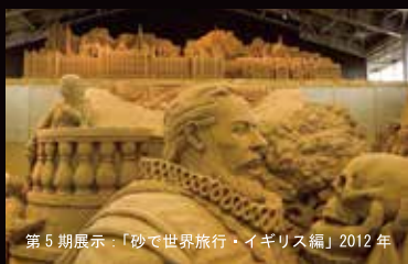
第5期展示：「砂で世界旅行・イギリス編」2012年